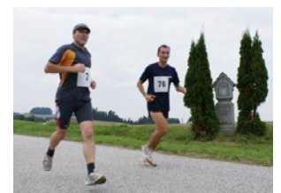
Mit vollem Einsatz unterwegs!