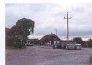
Gute Ideen sind gefragt